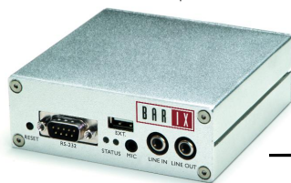
BARIX ANNUNICOM 100