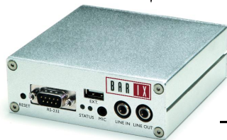
BARIX ANNUNICOM 100